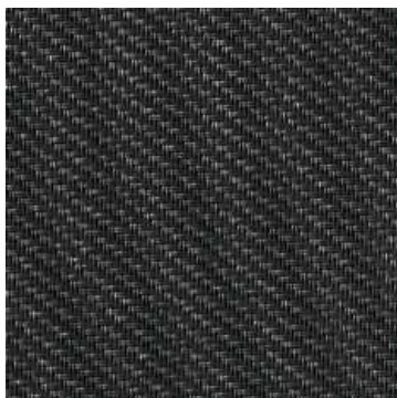
Glasfasergewebe Gewebe aus PVC-ummantelten Glasfasergarnen, Webart Sergé

Jeder Gewebetyp und auch jede Gewebefarbe hat ihre ganz spezifischen Eigenschaften z.B. hinsichtlich Wärmeschutz, Sichtschutz, Durchsicht nach draußen und Blendschutz. Auch Absorption, Reflexion und Transmission der Licht- und Wärmeenergie variieren. Lassen Sie sich diesbezüglich von Ihrem ROMA Fachpartner oder Architekten beraten.