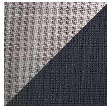
Spezialgewebe Gewebe mit Metall- oder Metalleffekt-oberfläche sowie Verdunklungsgewebe

Ausführliche Informationen zu den Geweben finden Sie im ROMA Gewebe-Berater.