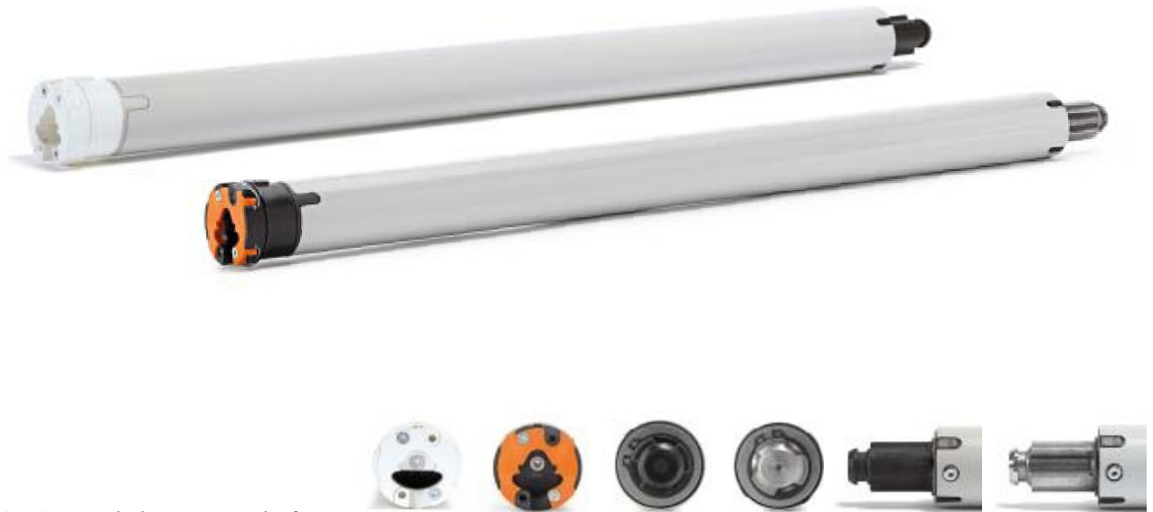
VariEco S mit weissem und schwarzem Motorkopf