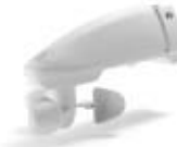
Sensoren ab Seite 158